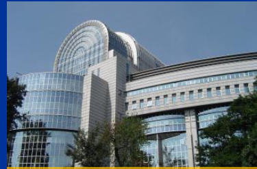
SEDE DEL PARLAMENTO EN BRUSELAS