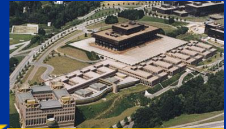
EDIFICIO DEL TRIBUNAL DE JUSTICIA