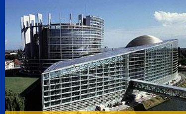
SEDE DEL PARLAMENTO EN ESTRASBURGO