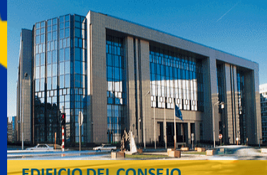
EDIFICIO DEL CONSEJO