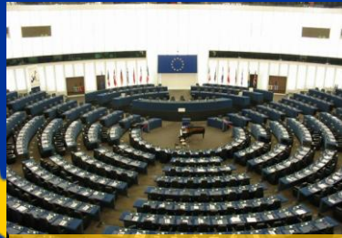
HEMICICLO DEL PARLAMENTO EN BRUSELAS